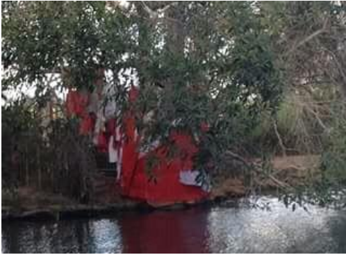
Un endroit sacré