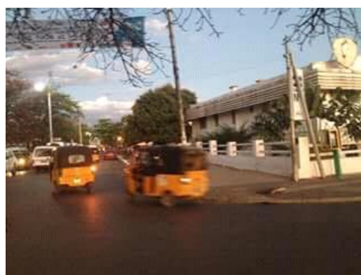
L'Hotel de ville